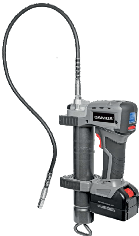
Sada AFP-S 400, obj. č. 33131

Zapsán do obchodního rejstříku u Krajského soudu v Ústí nad Labem v oddíle C, č. vložky 274